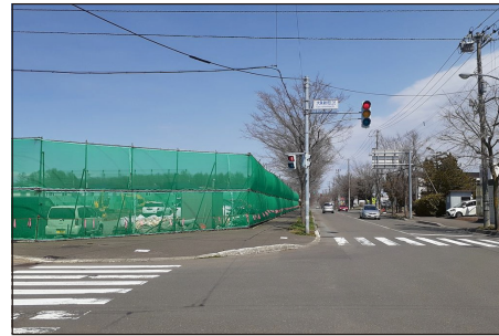
前面道路1番通より撮影