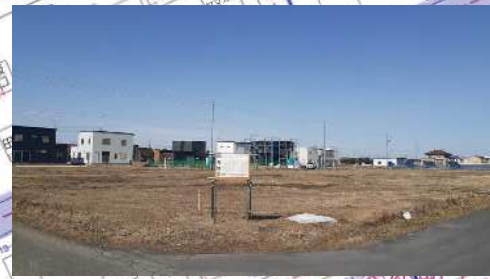
苫小牧市美原町1丁目16番9外分譲価格表