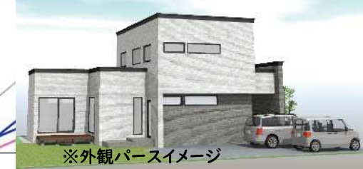
苫小牧市美原町1丁目16番9外分譲価格表