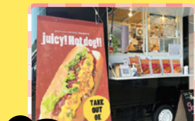
4/26(土) good time! ホットドッグ各種