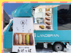
4/29(火祝) あげっぱ 揚げパン各種