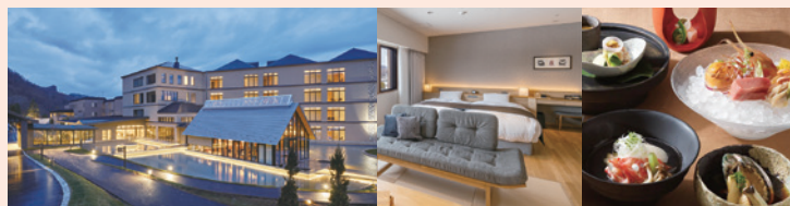
洞爺湖 鶴雅リゾート洗の謠 ペアご宿泊券