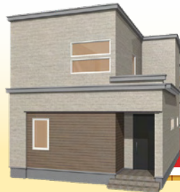
土屋ホーム 構造見学会