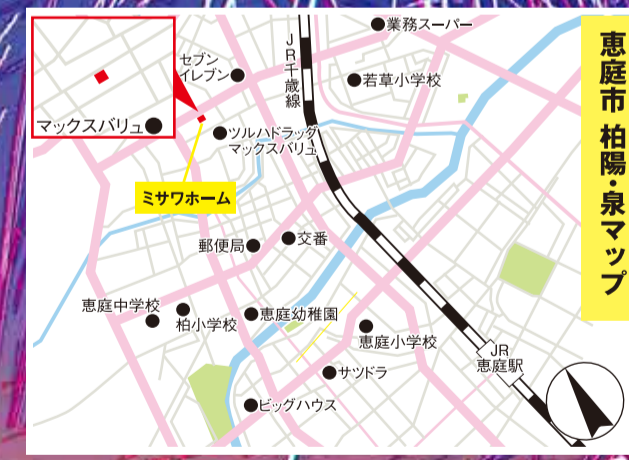
恵庭市柏陽・泉マップ

カーナビ 千歳市勇舞4丁目4番18 書斎や広々バルコニーなど 憧れのライフスタイルを 実現する4LDK。 北海道セキスイハイム 千歳恵庭 展示場 〒066-0032 千歳市北陽5丁目3-1 ☎0123-27-3816 Fax.0123-27-1660 http://www.hokkaido-heim.com 建設業許可/北海道知事許可(特-28)石狩第02050号 宅地建物取引業/北海道知事免許(12)第2509号 (公社)北海道宅地建物取引業協会会員 (一社)北海道不動産公正取引協議会加盟