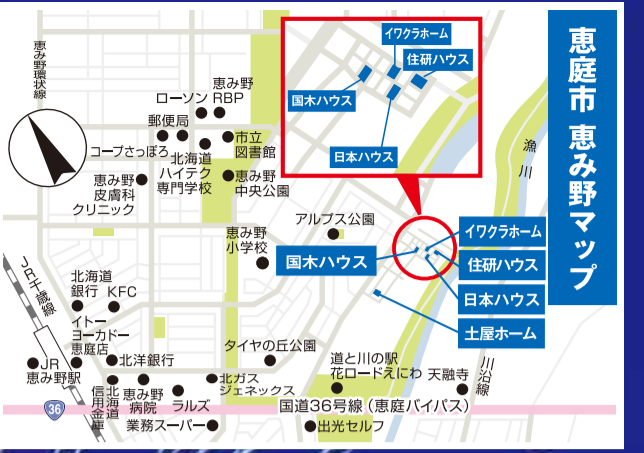
恵庭市恵み野マップ