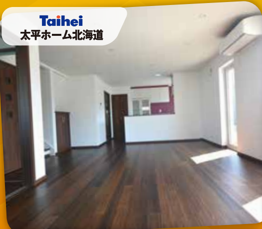
Taihei 太平ホーム北海道