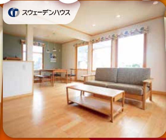
スウェーデンハウス