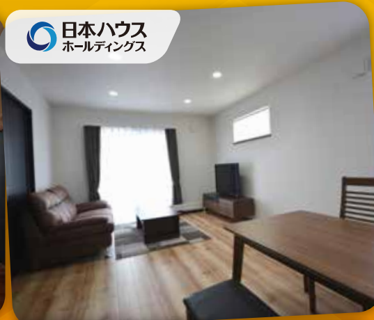
日本ハウス ホールディングス