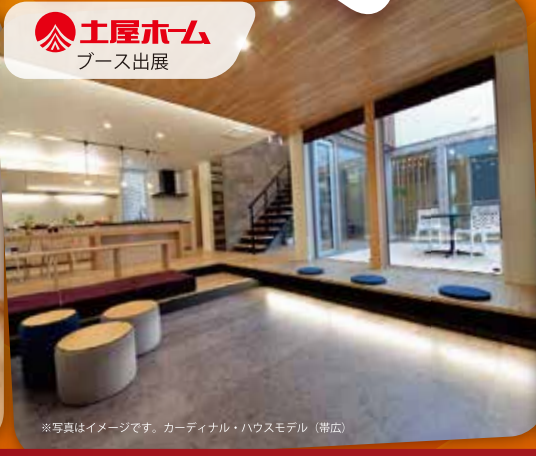
土屋ホーム ブース出展