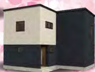
イクワホーム ブース出展