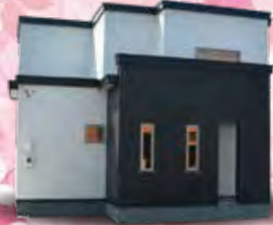
Taihei 太平ホーム北海道