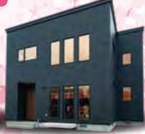
ホクトホーム ブース出展