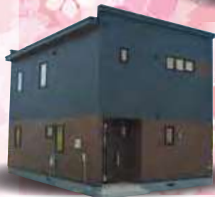
日本ハウス ホールディングス