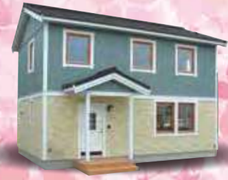
スウェーデンハウス