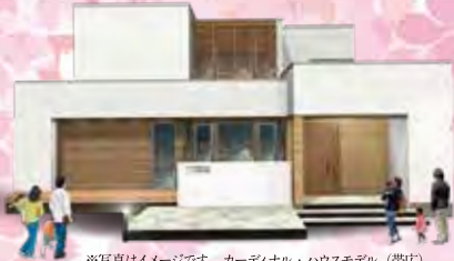
土屋ホーム ブース出展